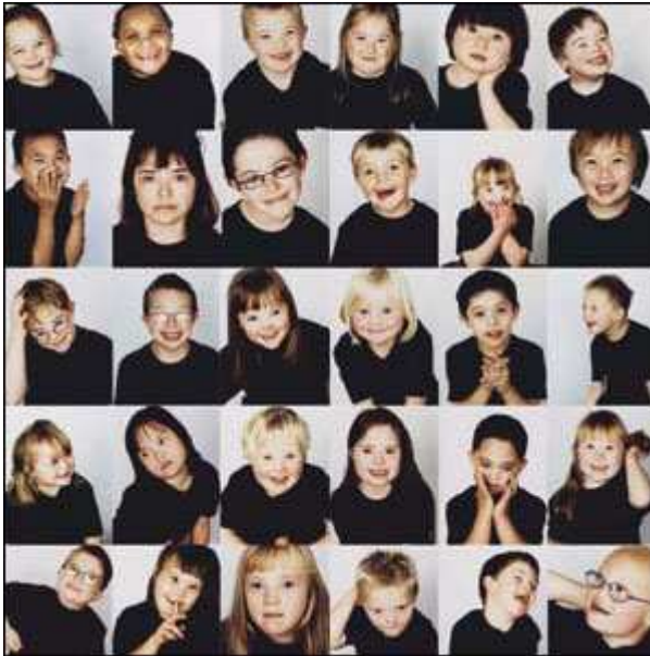
Figura 2 – Fáceis característica